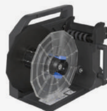
TU-RC7508 (Accesorio opcional - no viene incluido)